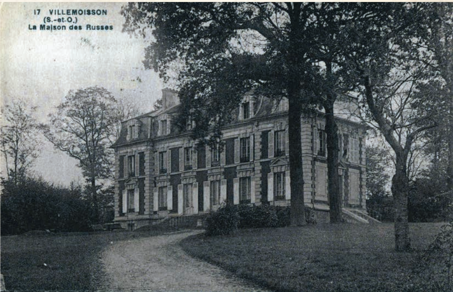
17 VILLEMORISON (S.-et-O.) La Maison des Russes